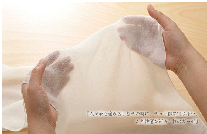
『人が最も痛み苦しむその時に、そっと傷に寄り添い、ただ快癒を祈る一枚のガーゼ』

ここで断られたら終わりだと覚悟をもって臨みました。その形相に相手は断りきれず思い悩んだ挙句「やらまいか！」そう一言いってくれたのでした。「やらまいか！」とは遠州人の方言で「あれこれ考え悩むより、まずは行動してみようじゃないか！」という進取精神の表れで、熱き遠州人の心に火をつけたのです。